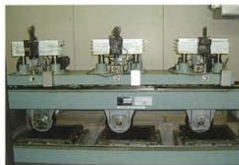
ホイールトラッキング試験▶

セナファルトHPは、超重交通路線などへの適用、小粒径化による騒音低減、長期供用維持など、様々なニーズに対応できる高耐久型ポリマー改質アスファルトです。